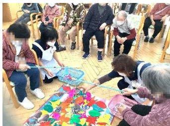
落ち葉拾いゲーム