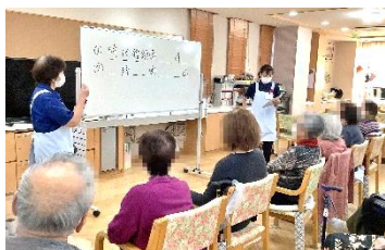
毎日楽しく脳トレ!本日は 四文字熟語穴埋めテスト