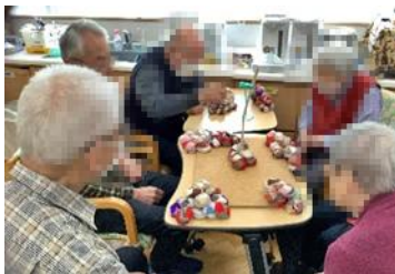
お手玉くずしゲーム