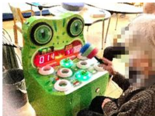
カエルポコポコゲーム