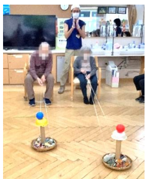
カップタワーピンポンのせ こっちこいゲーム(長!)