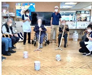
人気のカーニリングゲーム