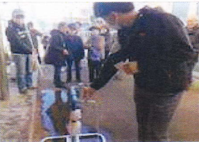
蛇口スタンド設置