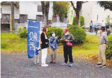
6地区 区割り一般者