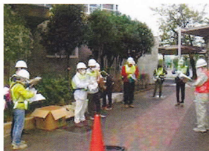
区割りカード配布訓練