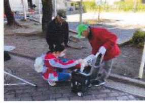
ガス式発電機訓練