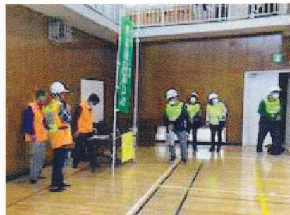
アマチュア無線交信