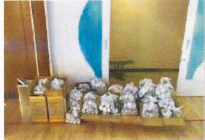
災害時のペット避難